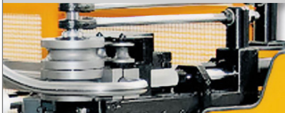
PROVAR 5 U-D