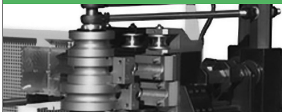
PROVAR 6 U-D