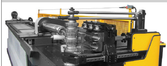
PROVAR 6 U-D