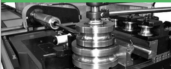
PROVAR 5 U-D